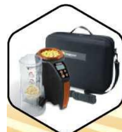
Balenie obsahuje: mini GAC 2500, násypka, 9 V batéria, ochranný kufrík, návod na obsluhu