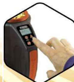
4. Zatláčir Enter pre zobrazenie výsledku