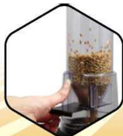
2. Vyprázdniť do meracej komory