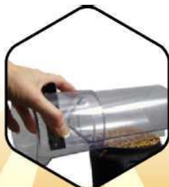
3. Zarovnať grain