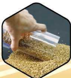
1. Naplniť násypku