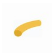
EDPM hadice Ø6,4/11,2 mm